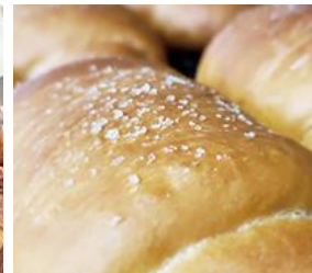
パン工房 パンツクルヒト (塩パン)