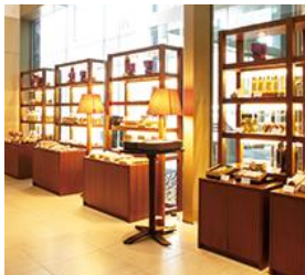
ウェスティンホテル仙台 ペストリーショップ(パン)