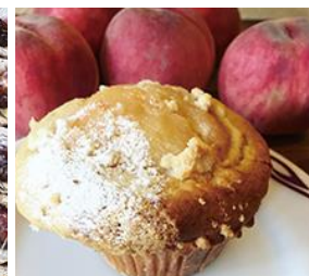
デイリーズ・マフィン (マフィン)