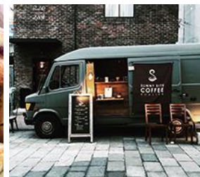
SUNNY SITE COFFEE (コーヒー)