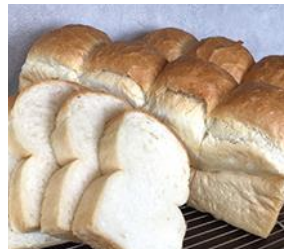
はやさか製パン (パン)