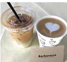
Barbaresco (コーヒー・ドリンク)