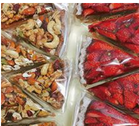
twins bake (ヴィーガンスイーツ)