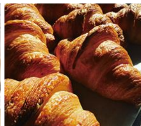
HOLLY No.3 CROISSANT (クロワッサン)