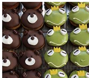
OVAL COFFEE STAND (コーヒー・ドーナツ)