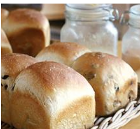
zizo+ベーカリー (天然酵母パン)