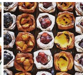
カカホベーカリー (パン・焼き菓子)