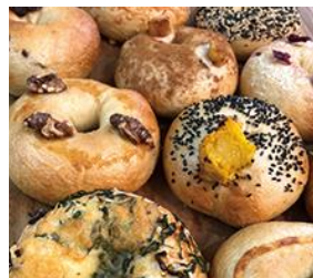
暮らしづくりベーグル& コーヒー(ベーグル・コーヒー)