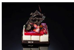
ル ジュール メルヴェイユ

予約期間：12月20日(日)まで 予約方法：ホームページ、お電話、店頭 お渡し日時：12月23日(水)～12月27日(日) 12:00～19:00 お渡し場所：ペストリーショップ(1階)