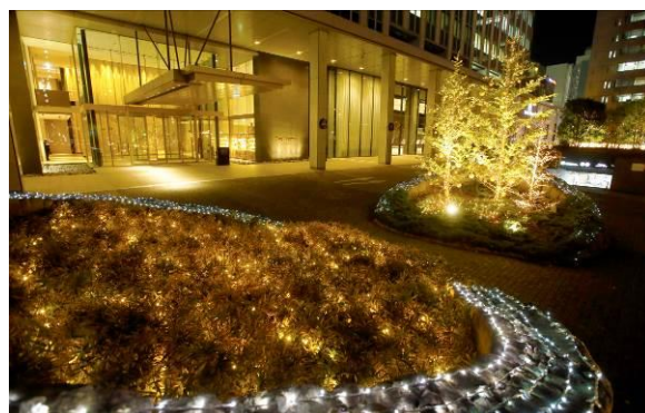
ホワイト&ゴールドのサークルイルミネーション