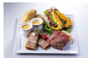
マルシェ ド ノエル