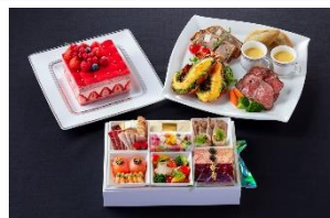
ノエル アンサンプル

予約期間：12月20日(日)まで 予約方法：ホームページ、お電話、店頭 お渡し日時：12月23日(水)～12月27日(日) 12:00～19:00 お渡し場所：ペストリーショップ(1階)