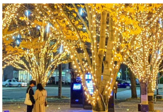
※写真は過去の受賞写真です。