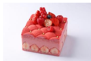
マトラッセ フレーズ