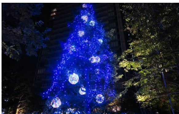
ブルーイルミネーションツリー