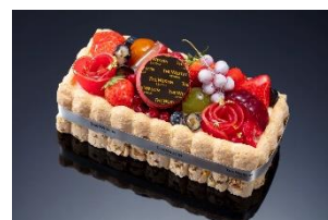
シャルロット フリュイ

開業10周年を記念しフォトフレームに見立てた「ル ジュール メルヴェイユ」やいちごを贅沢に使用した「マトラッセ フレーズ」など、テーブルを華やかに彩る3種類のオリジナルケーキをご用意いたしました。