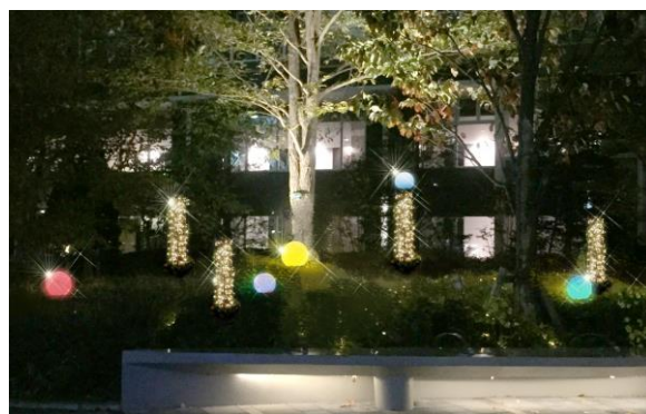
色が変わるスマートポールイルミネーション