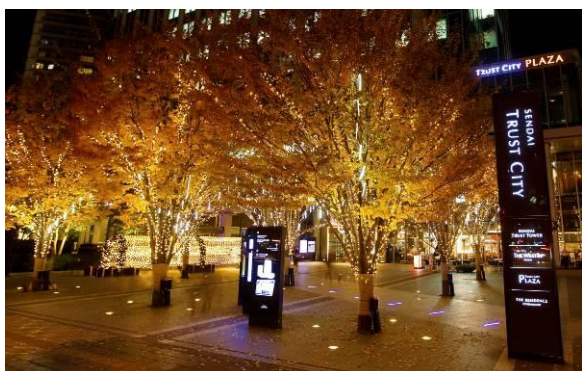
シャンパンゴールドのイルミネーション