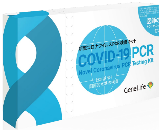
新型コロナウイルス PCR 検査キット【日本基準+国際的水準の検査】 イメージ

今回、森トラストからご提案する GeneLife ジーンライフ の「新型コロナウイルス PCR 検査キット【日本基準+国際的水準の検査】(COVID-19 PCR Novel Coronavirus PCR Testing Kit)」は GeneLife の検査実施機関において、日本の国立感染症研究所とアメリカ疾病予防管理センターによる検査基準の両方を満たした国際水準の厳しい検査方法で解析する、簡単・安心・安全なキットです。