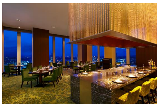
ウェスティンホテル仙台 レストラン シンフォニー