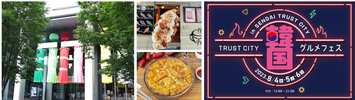
七夕飾り(2022年開催時の様子)

本イベントでは、仙台トラストシティで仙台最大級の七夕飾りを眺めながら、話題の韓国グルメをお楽しみいただけます。400年の歴史を誇る東北を代表する伝統行事「仙台七夕まつり」(8月6日から8月8日開催)とともに、仙台の街を盛り上げます。