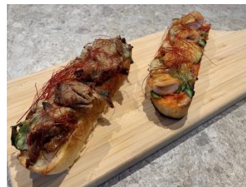
(左)牛肉プルコギクロスティニー (右)チヂミ風クロスティニー

仙台トラストシティ1階「Pizzeria LAVAROCK(ピッツェリア ラヴァロック) 仙台」では、本イベントコラボメニューを販売いたします。LAVAROC オリジナルのトマトソースを使ったイタリアのパン料理「クロスティニー」を、キムチ、チーズなどと合わせ韓国風アレンジした、“チヂミ風クロスティニー”、“牛肉プルコギクロスティニー”などをご用意。新感覚の期間限定メニューを、ぜひご賞味ください。