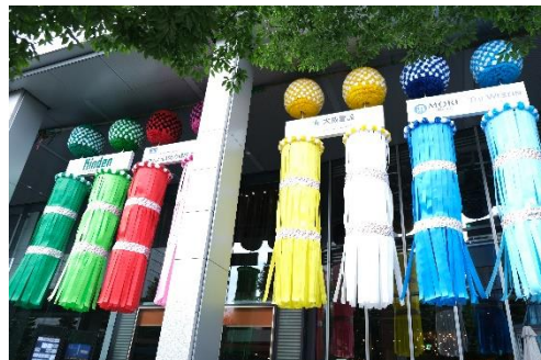
2022年に設置された七夕飾り