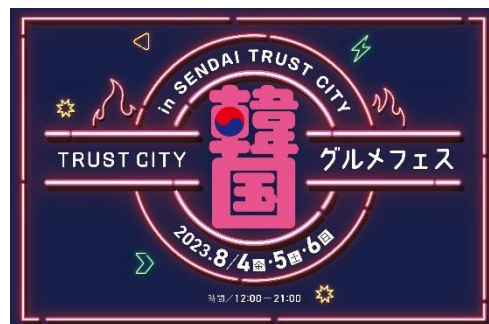
「TRUST CITY 韓国グルメフェス」ロゴ