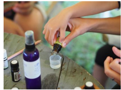
アロマ虫よけスプレー作りイメージ

庭園に生息する植物の成分を利用したアロマ虫よけスプレー作りにもチャレンジして、生きものと人との繋がりも体感してみましょう。