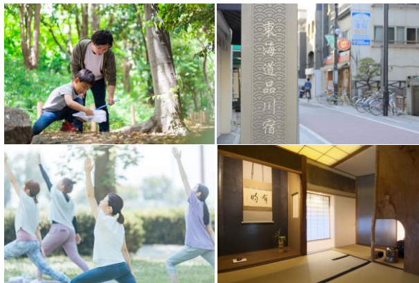
御殿山モノガタリ 2023 イベントイメージ