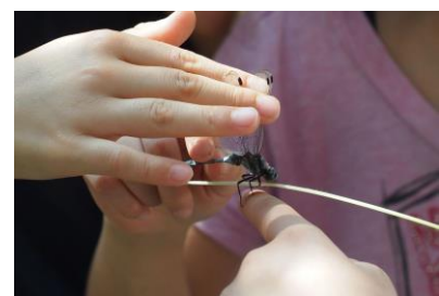
水辺の生きもの観察 イメージ (シオカラトンボ)

当日は、メダカやエビなどの庭園内に生息する生きもののご紹介と、シオカラトンボやアジイトンボの幼虫とアメンボの観察を行う予定です。