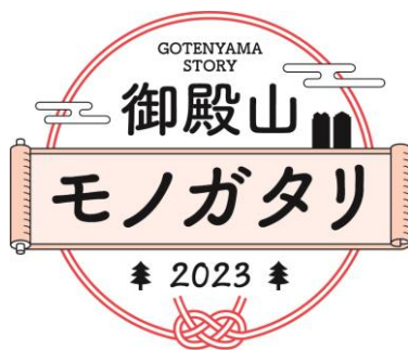
御殿山モノガタリ 2023 ロゴ