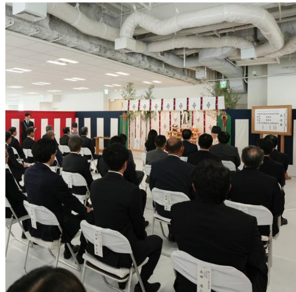
「東京ワールドゲート赤坂」 竣工式の様子

「東京ワールドゲート赤坂」は、東京圏国家戦略特別区域(通称「国家戦略特区」)における国家戦略都市計画建築物等整備事業として認定を受けた、虎ノ門・赤坂エリアの国際競争力強化を推進する大型複合開発プロジェクトです。街区コンセプトに「Next Destination」を掲げ、従業員エンゲージメントの向上に資するオフィスフロアの提供や、国際水準のホテルおよびサービスアパートメントの展開を予定しています。加えて、赤坂の地に根ざした歴史文化を発信する施設の開設、大規模緑地の整備などを通じて、ビジネスと観光の両面から、世界と日本をつなげるゲートの機能を担うような拠点づくりを進めております。